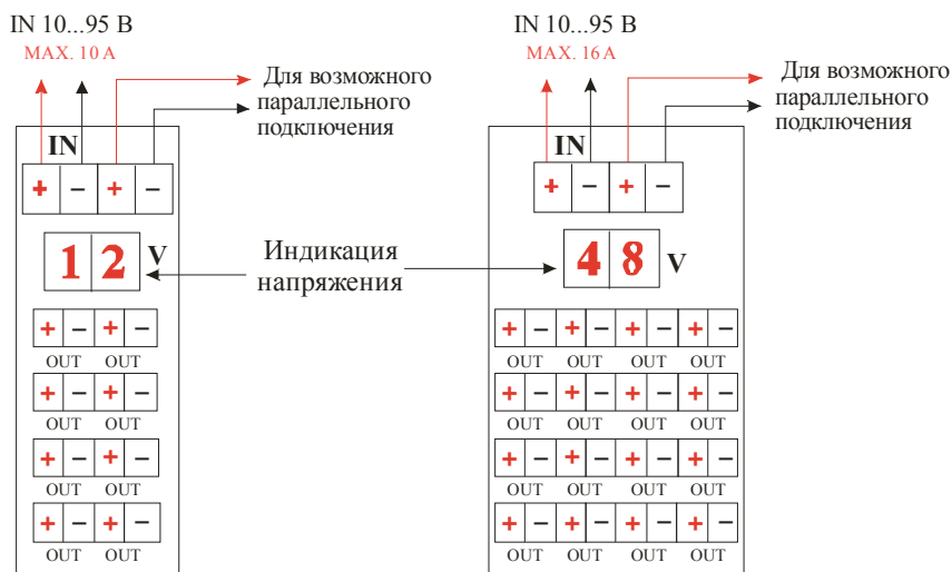
Рис 1. Схемы подключения.